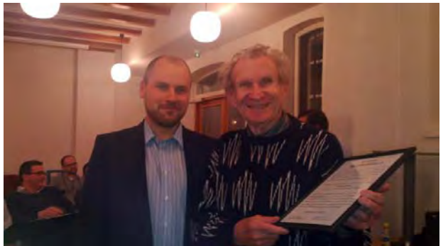
Bosse (t.h.) som inte var på plats i Jakobstad blev uppvaktad med hedersmedlemsdiplomet i samband med en efterföljande ÅSMA-körövning.