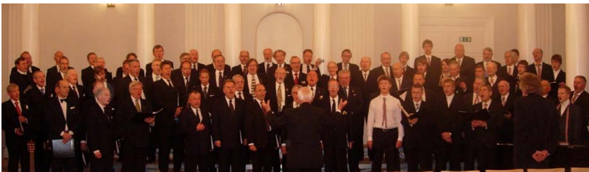
BÄD och värdkören Gaudeamus sjunger Sangerhilsen tillsammans under konserten på Tartu universitet.

Efter lunch och lätt vila var det så dags för konserten i universitets solennitetssal, som redan den var en upplevelse. Härliga pelare med vackra kronor i ett stort ljusst rum. För att inte tala om akustiken, som enligt mångas mening var något av det bästa