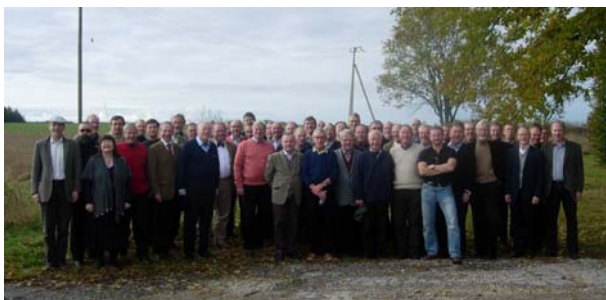
Dorpat-resenärerna, någonstans på den estniska landsbygden

"Det var en märklig upplevelse, vår körresa till Dorpat, en djupdykning i en hel massa olika slags minnen. Poeten talar om 'minnenas skattkammare'. Jag tänker på alla bekanta från olika sångårar i BD, gemensamma projekt från annodazumal, etce- tera. Firade julkonserter, Catulli Carmina & Car- mina Burana, BD:s Bellmaniana i Solennitetssalen mm."